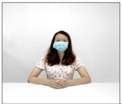
图2：正前方第一机位效果图。