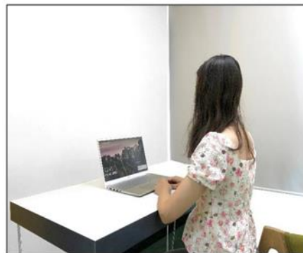
图3：侧后方第二机位效果图。